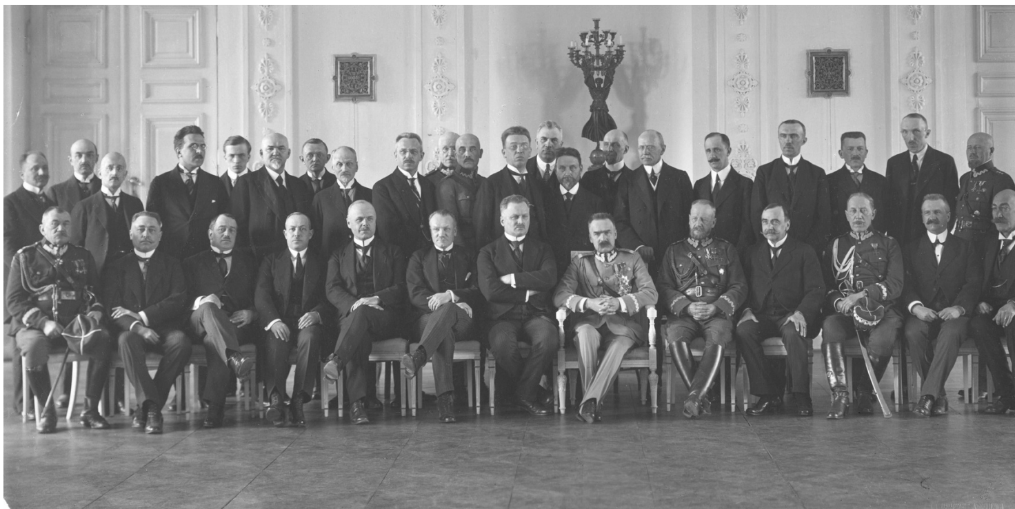
Uroczystość przyłączenia Wileńszczyzny do Polski, 18 kwietnia 1922 r.

https://przystanekhistoria.pl/pa2/tematy/litwa/76000,Wilenszczyzna-Inkorporacja-zamiast-federacji.html