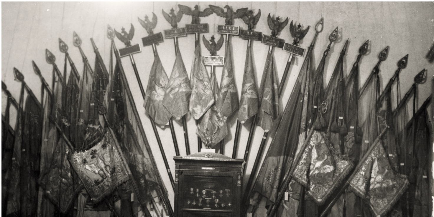
Fragment wystawy w Muzeum Narodowym w Warszawie okazji 100 rocznicy powstania listopadowego, 1931 r.

https://przystanekhistoria.pl/pa2/tematy/litwa/43414,Jelismy-sie-oreza-w-duchu-jednosci-z-Krolestwem-Polskim-Powstanie-Listopadowe-na.html