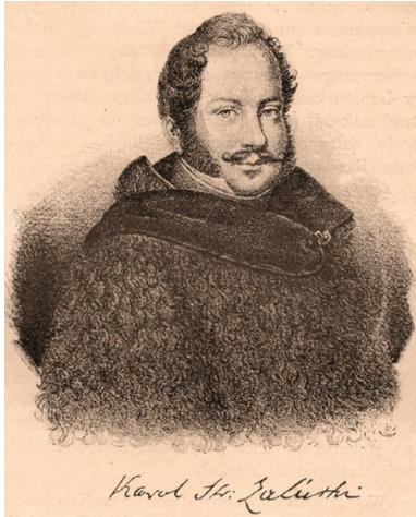
Karol Załuski, naczelnik powstania na Litwie