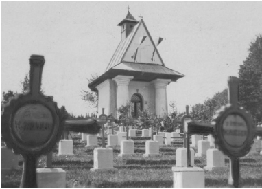
Cmentarz Legionistów w Łowczówku na zdjęciu z okresu międzywojennego