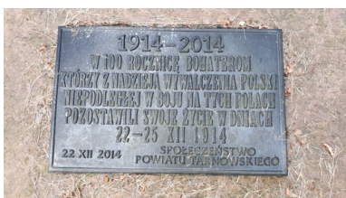
Tabliczka pamiątkowa upamiętniająca 100-lecie bitwy