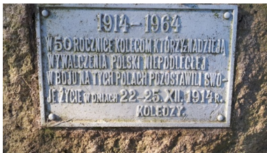
Tabliczka pamiątkowa upamiętniająca 50-lecie bitwy pod Łowczówkiem.

Natarcie prowadzone siłami polskich batalionów, a także przez żołnierzy piechoty węgierskiej oraz ogniem artylerii austriackiej, zakończyło się sukcesem. Oddziały legionowe wykonały swoje zadania, pas wzgórz został odbity. Rosjanie, nie dając za wygraną, przygotowywali przeciwnatarcie. Ogień artylerii i karabinów maszynowych odciął legionistom zaopatrzenie oraz komunikację z dowództwem. W nocy z 23 na 24 grudnia wojska carskie podeszły na bliską odległość, w niektórych miejscach poniżej 50 kroków. Przez cały dzień wigilijny trwał morderczy pojedynek ogniowy oraz odpieranie kontrataków rosyjskich. Przed zmierzchem 24 grudnia Kazimierz Sosnkowski otrzymał rozkaz wycofania brygady. Rozkaz okazał się on jednak nieporozumieniem, co jednak wyjaśniło się po wycofaniu się Polaków. Opuszczone pozycje trzeba było na nowo zdobywać.