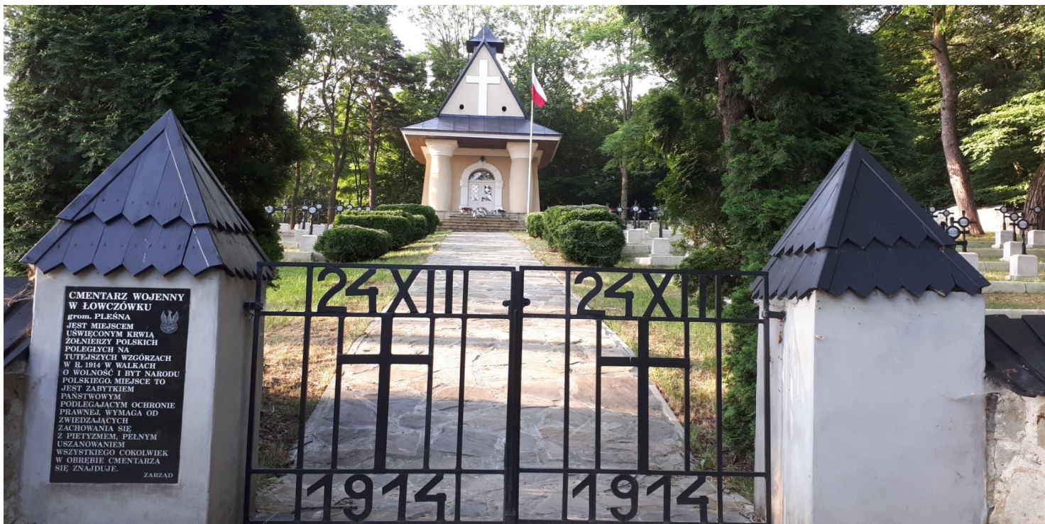
Brama prowadząca na cmentarz legionowy w Łowczówku.

https://przystanekhistoria.pl/pa2/tematy/legiony/97597,Legionowa-Wigilia.html