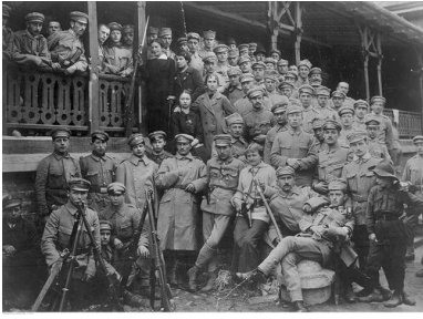
Strzelcy na krakowskich Oleandrach, sierpień 1914 r.