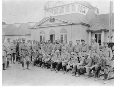
Strzelcy na krakowskich Oleandrach, sierpień 1914 r.