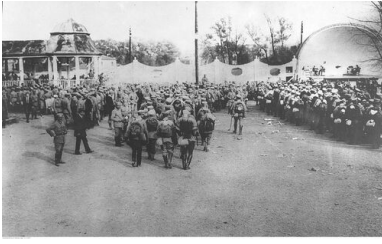
Strzelcy na krakowskich Oleandrach, sierpień 1914 r.