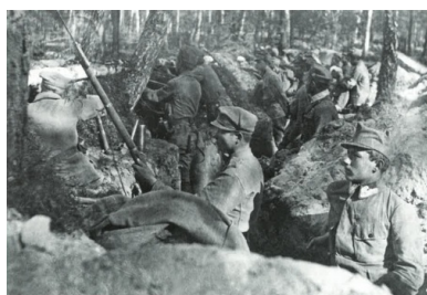
Żołnierze II Brygady Legionów Polskich w okopie - pozycje nad Styrem, na Wołyniu.