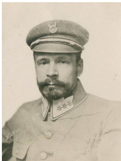
Pułkownik Józef Haller po wyjściu ze szpitala w 1915 r.

niektórymi postulatami zawartymi w memoriale później został utworzony Polski Korpus Posiłkowy.