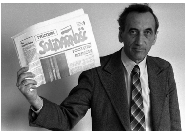
Tadeusz Mazowiecki

Atmosfera panująca w barze zaczynała przypominać ostatnie chwile rejsu „Titanica”.