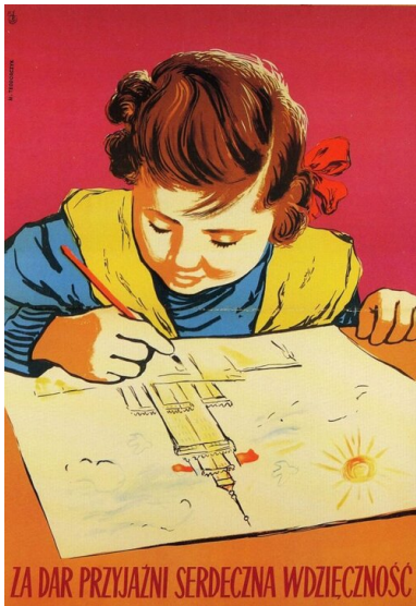
Plakat propagandowy kolportowany z okazji budowy Pałacu Kultury i Nauki im. Józefa Stalina w Warszawie.

Przyjęto, że literatura powinna koncentrować się na tematyce wroga klasowego, ukazywaniu wybitnych przywódców, potęgi socjalistycznego państwa, jego gospodarki itp.