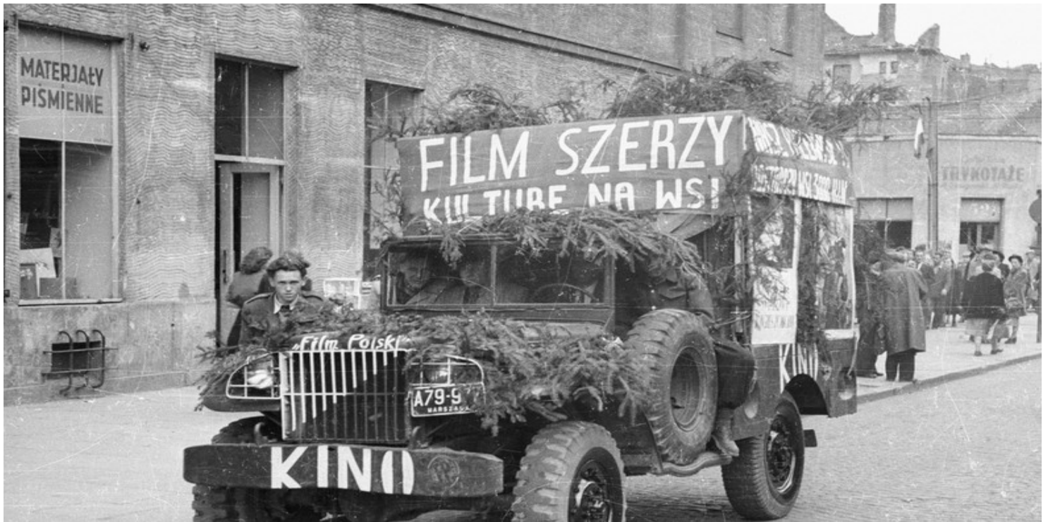
Akcja nagłaśniająca przyjazd kina objazdowego

https://przystanekhistoria.pl/pa2/tematy/kultura/93406,Kultura-i-nauka-w-sluzbie-ideologii.html