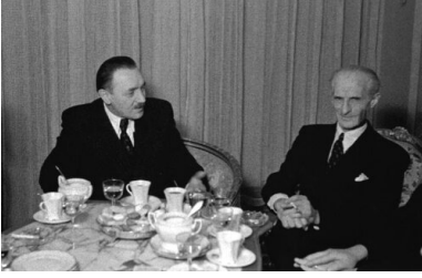
Bolesław Bierut i Julian Tuwim