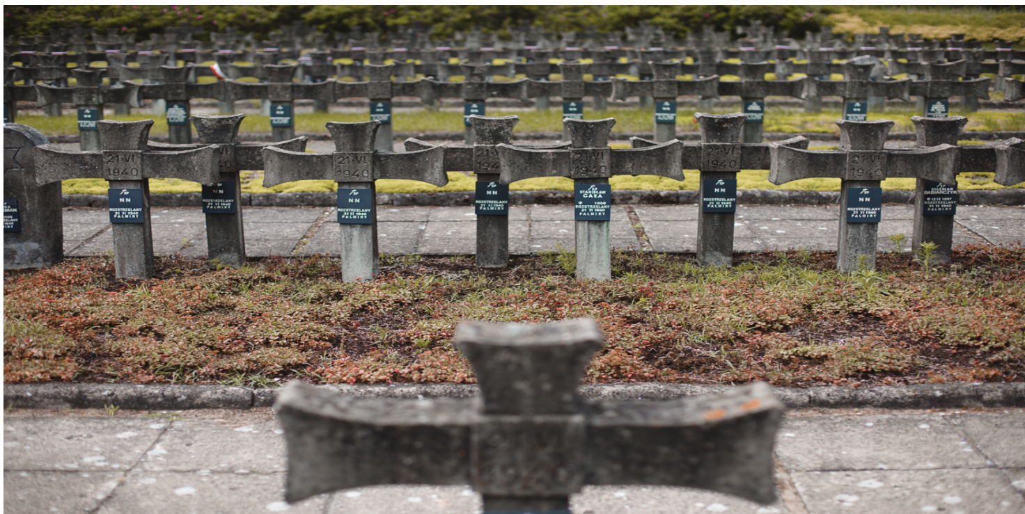
Utworzony po wojnie cmentarz w Palmirach – miejsce pamięci pomordowanych – 2020 r.

https://przystanekhistoria.pl/pa2/tematy/kultura/93028,Witold-Hulewicz-poeta-radiowiec-i-konspirator.html