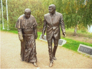
Pomnik papieża Jana Pawła II i prezydenta USA w l. 1981-1989 Ronalda Reagana w Gdańsku