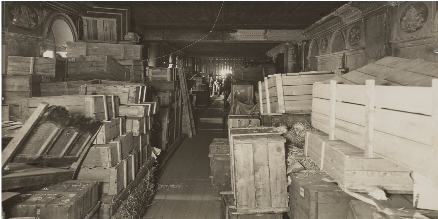
Zbiory Biblioteki Narodowej przechowywane czasowo w Zamku Królewskim w Warszawie.

https://przystanekhistoria.pl/pa2/tematy/kultura/84985,Ratowanie-zbiorow-bibliotecznych-w-powojennej-Polsce.html