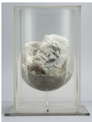
Urna z popiołami rękopisów i starodruków spalonych przez wojsko niemieckie w roku 1944 w

Wraz z przesuwaniem się frontu wschodniego rozpoczęto ratowanie księgozbiorów. Zadanie było szalenie trudne do wykonania z wielu względów. Brakowało m.in. specjalistów, środków finansowych, sprzętu do zwożenia tomów czy pomieszczeń do składowania książek. Ratowanie dzieł nigdy nie należało do zadań priorytetowych w czasach odbudowy kraju i niepewności związanej z podporządkowaniem państw Europy Środkowo-Wschodniej Związkowi Sowieckiemu. Liczne księgozbiory oraz ich fragmenty przetrwały i wymagały niezwłocznego zabezpieczenia. Na Ziemiach Zachodnich, włączonych do Polski w wyniku zmiany granic, zachowały się głównie księgozbiory proveniencji niemieckiej. Także w rezydencjach ziemiańskich pozostały zbiory pozbawione należytej opieki. Dziełom tym, w wyniku zlikwidowania w 1945 r. warstwy ziemiańskiej, groziło fizyczne zniszczenie. Armia Czerwona wywoziła je na wschód jako „materiał trofeiczny”. Kolejnymi problemami były powojenny szaber i palenie dworów. Nieliczna grupa osób, nie bacząc na przeszkody, przystąpiła do ratowania zachowanych materiałów piśmienniczych.