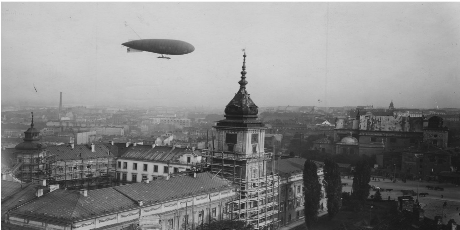
Widok z góry w kierunku południowym na Zamek Królewski i fragment Krakowskiego Przedmieścia - 1926 r.

https://przystanekhistoria.pl/pa2/tematy/kultura/81754,Zamek-Krolewski-w-Warszawie.html