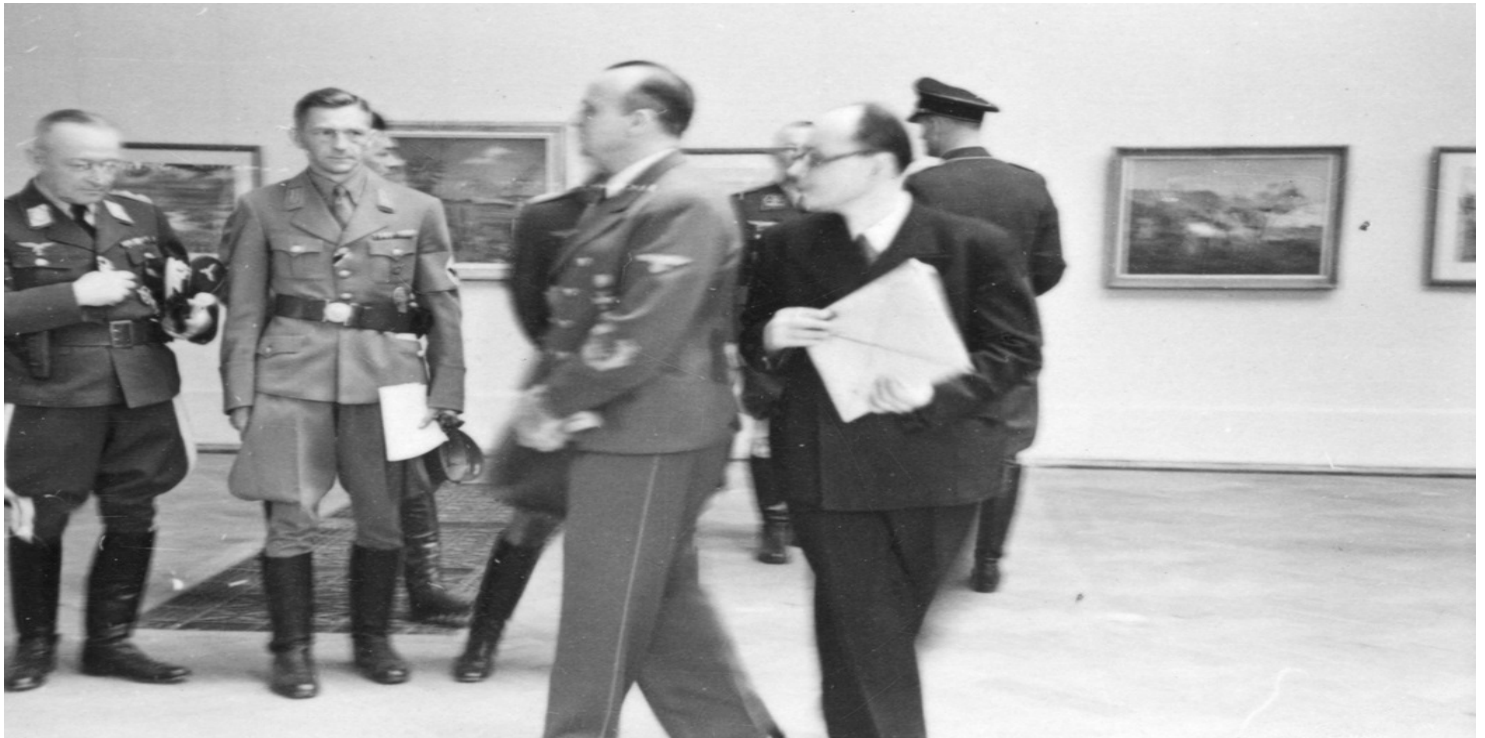
Hans Frank (3 z lewej) w towarzystwie oficerów i cywilów zwiedza nierozpoznaną galerię.

https://przystanekhistoria.pl/pa2/tematy/kultura/81014,Portret-niemieckich-grabiezcow.html