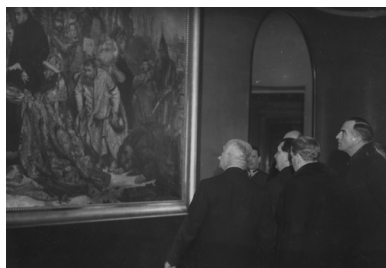
Hermann Goring w towarzystwie nierozpoznanych osób ogląda obraz "Batory pod Pskowem" w sali Batorego na Zamku Królewskim.