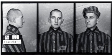
Franciszek Blachnicki w KL Auschwitz, 1940.

Boski dar wolności może być w pełni wykorzystany przez człowieka tylko w połączeniu z miłością. Takie pojmowanie źródeł ludzkiej wolności prowadziło ks. F. Blachnickiego do bezbłędnego diagnozowania przyczyn i form zniewolenia – zarówno osoby ludzkiej, jak i całych społeczeństw. Zniewolenie zawsze ma swoje podstawy w fałszywej wizji ludzkiej wolności. Polega na niewłaściwym użytku z wolności, jest bowiem wypaczeniem miłości przez zwrócenie jej ku sobie 6 .