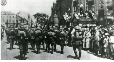
Wkroczenie wojsk polskich do Kijowa w 1920 r. Przemarsz piechoty ulicami miasta.

Wojna to nie tylko ciąg walk, zwycięstw i klęsk, lecz także żywioł porywający i przemieniający ludzi w obliczu nieustającej obecności śmierci; to zjawisko, które wymyka się ludzkiemu panowaniu i rozumieniu. Jeden z bohaterów powieści, por. Paprosiński, tak to widzi: