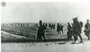
Wojna polsko - bolszewicka. Piechota w kontrofensywie - rozrzucony w tyralierze oddział polskiej piechoty.