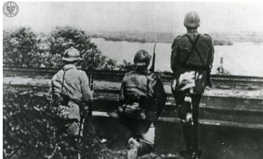
Wojna polsko - bolszewicka, 1920. Polska placówka nad Dnieprem.

Zarazem w tę ponurą postać pisarz wprowadził skomplikowaną, właściwie sprzeczną motywację. To nie tylko na przemian łęki i agresja, lecz i desperacja w dalszych zbrodniach, później autoagresja, poczucie winy i przecucie, że zbrodnia nie może ujść bezkarnie, wewnętrzne piekło, które przeżywał Kłos, obłądne koło zniszczenia i samozniszczenia, walki instynktu życia i instynktu śmierci. Policjant nie wiedział w końcu, czy w sytuacji wojennej zagłady staje po stronie życia, czy po stronie śmierci, ale przeczuwał, że nowa władza i nowa siła, która przynosi zwycięstwo nad dotychczasowym światem, wcale nie zapewni pełnej racji, wewnętrznego spokoju i oczekiwanego spełnienia. Dlatego w końcu stanął sam przeciwko sobie, nie uciekał przed wyrokiem, jaki na niego wydano.