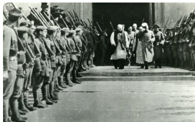
Polska, Wilno, katedra. Józef Piłsudski wychodzi po nabożeństwie po odzyskaniu przez Wojsko Polskie Wilna, 23 kwietnia 1919 r.

Tak doczekali pod Wilnem wiosny 1920 r., ale nadal nic nie zapowiadało rozpoczęcia walki z bolszewikami. Trwały jakieś pertraktacje, a jak się okazało, była to zwłoka, która pozwoliła bolszewikom na przegrupowanie się, zebranie sił i przejście do ataku.