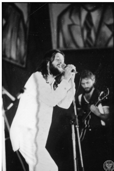
Koncert zespołu Dżem. Na pierwszym planie frontman Ryszard Riedel; za nim gitarzysta Adam Otręba. Gdańsk, 20-22 sierpnia 1981 r.

sposób symboliczny zawierała miejsce dla aktualnego przywódcy partii Wojciecha Jaruzelskiego. Scenografię wymyślił i wykonał grafik i twórca filmów animowanych Andrzej Czeczot. Poszczególne jej elementy powstały w pracowni Teatru Wybrzeże. Na ścianach hallu rozwieszono afisze o „prawdach” wyczytanych w „Trybunie Ludu”, pomazane czerwoną farbą przedruki dotyczące IX Zjazdu PZPR, a po podłodze stąpano po gazetach wydawanych w innych państwach bloku wschodniego. Po rozmowie ostrzegawczej wicewojewody i prezydenta Gdańska z organizatorami przeglądu w drugim dniu festiwalu portrety przysłonięto transparentem NSZZ „Solidarność”. Zaproszeni artyści zgodzili się występować bez honorarium. Na imprezę zaproszono ponad 200 dziennikarzy i 15 ekip telewizyjnych w tym wiele zagranicznych. Przegląd cieszył się ogromnym zainteresowaniem. Sprzedano komplet biletów na wszystkie dni festiwalu. Cały dochód przekazano na konto NSZZ „Solidarność” Region Gdańsk z przeznaczeniem na cele społeczne.