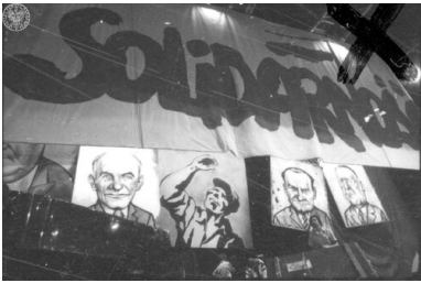
Scena z karykaturami przywódców partyjnych przysłonięta transparentem NSZZ "Solidarność". Gdańsk, 20-22 sierpnia 1981 r.

Imprezę „zabezpieczały operacyjnie” cztery wydziały Komendy Wojewódzkiej MO oraz Służba Bezpieczeństwa z Gdańska. Funkcjonariusze nagrywali przebieg festiwalu, dokumentowali wszelkie wystąpienia o charakterze „antypaństwowym i antyradzieckim” oraz notowali i donosili przełożonym o wszelkich niepożądanych dla władz reakcjach publiczności. Wykorzystano też podsłuchy i kamery zainstalowane w hotelach, w których zatrzymali się goście. W raporcie szefa KWMO w Gdańsku wysłanym do Warszawy znalazły się stwierdzenia na temat marginalnego charakteru imprezy i niskiego poziomu artystycznego prezentowanych na niej utworów. Organizatorom zarzucono brak scenariusza, bazowanie na improwizacji i żywiołowych reakcjach słuchaczy. Według tego dokumentu publiczność niejednokrotnie miała opuszczać widownię „demonstrując tym swoje niezadowolenie z jego przebiegu, a przede wszystkim dłużyzn, monotonii niektórych utworów i niesprawności organizacyjnej”. Funkcjonariusze SB w celu zdyskredytowania przeglądu rozkolportowali w czasie imprezy różnego rodzaju ulotki, wiersze satyryczne i plakaty.