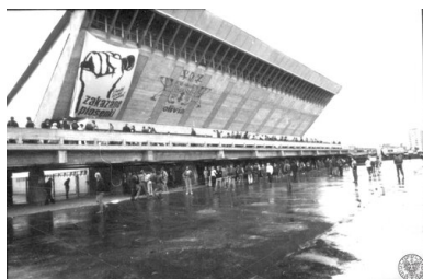
Ludzie przed Halą Olivia w Gdańsku. Na gmachu budynku plakat "Zakazane piosenki". Gdańsk, 20-22 sierpnia 1981 r.