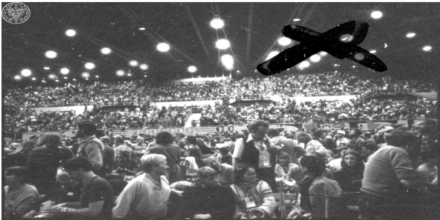
Widok ogólny na widownię w hali Olivia. Gdańsk, 20-22 sierpnia 1981 r.

https://przystanekhistoria.pl/pa2/tematy/kultura/72477,Piosenki-zakazane-bo-prawdziwe.html