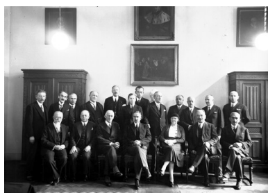
Otwarcie lektoratu języka szwedzkiego na Uniwersytecie Jagiellońskim w Krakowie. Fotografia grupowa uczestników uroczystości. Widoczni m.in.