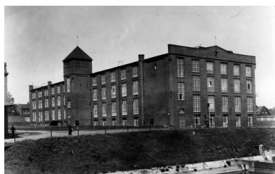
Zakłady Włókiennicze Widzewska Manufaktura S.A. w Łodzi - budynek przędzalni egipskiej. 1938. Druga Rzeczpospolita.

W okresie międzywojennym miasto nie odzyskało dawnej świetności. Działo wraz z całą II Rzeczpospolitą ekonomiczne trudności polskiego międzywojnia – kryzys powojenny; chaos hiperinflacji w latach 1922–1923 oraz zapaść Wielkiej Depresji z pierwszej połowy lat trzydziestych. Sytuację ekonomiczną Łodzi pogłębiał jeszcze permanentny lokalny kryzys gospodarczy, wynikający z utraty wschodnich rynków zbytu i rosyjskiego zaplecza surowcowego. Ten stan rzeczy wpływał negatywnie na atrakcyjność dawnego polskiego Manchesteru jako ewentualnego celu zarobkowej migracji – nawet w sytuacji, gdy w Polsce międzywojennej Łódź stała się stolicą nowego województwa. Liczebność mieszkańców miasta rosła wolniej niż w okresie poprzedzającym wybuch I wojny światowej. Na skutek przyrostu naturalnego, ale przede wszystkim powrotu łodzian, którzy opuścili miasto w latach wojny, i nowych migracji ludności wiejskiej z prowincji, nad Łódką w 1919 r. mieszkało ponad 400 tys. osób, w 1931 r. – ok. 605 tys., wreszcie w 1939 r., w przededniu II wojny światowej – przeszło 670 tys. Polaków, Żydów i Niemców.