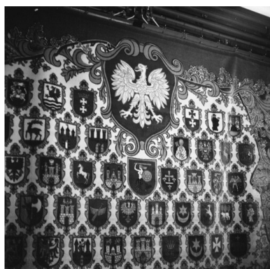
Jeden z produktów Fabryki Dywanów „Dywilan” w Łodzi.

Charakterystyczną gwałtowność politycznych sporów i prawdziwą huśtawkę preferencji wyborczych łodzian przed II wojną światową tylko po części zdefiniować można jako pochodną tendencji ogólnopolskich. Ich wyjaśnienia należy się doszukiwać raczej we wspomnianej już wcześniej charakterystycznej tendencji łódzkiej społeczności (w tym najliczniejszego w niej środowiska robotniczego) do cyklicznego „odmładzania się”, a zarazem wymiany ludności w wyniku napływu mieszkańców wsi w ostatnich latach „ziemi obiecanej” oraz po zakończeniu Wielkiej Wojny. Wśród pierwszego pokolenia społeczności robotniczej zrosła sympatia pracobiorców do idei prospołecznych i lewicowych krzyżowała się z wartościami tradycyjnymi, ludowymi i konserwatywnymi, a autorytet socjalistycznego trybuna zderzał się z powagą stanowiska Kościoła i wspieranych przez niego polityków. Równocześnie nakładanie się (a w wyniku tego wzmacnianie) różnic społecznych, narodowościowych i etnicznych – wywołujących przeciwstawienie stereotypu Polaka-robotnika-katolika Niemcowi-fabrykantowi-ewangelikowi i Żydowi-„starozakonnemu”-bankierowi – sprzyjało interpretowaniu haseł narodowych w kategoriach obrony społecznego interesu polskiego pracobiorcy wobec niemieckiego przedsiębiorcy i żydowskiego „spekulanta”. W tej sytuacji elektorat robotniczy łatwo zmieniał sympatie polityczne, lokując je na zmianę po stronie obozu narodowego lub socjalistycznego.