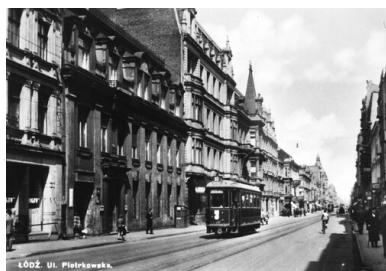
Ulica Piotrkowska w Łodzi. Druga Rzeczpospolita.