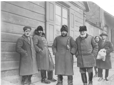
Grupa mężczyzn z łódzkiej dzielnicy Bałuty. W środku widoczni dwaj dorożkarze. 1931. Druga Rzeczpospolita.

Tymczasem w świetle niezwykłych procesów, zaskakujących przełomów i dramatycznych zwrotów historycznych to raczej późniejsze losy miasta nad Łódką zasługują na miano prawdziwego fenomenu. W pełni usprawiedliwiają to określenie burzliwe wówczas dzieje wielonarodowościowej i wielokulturowej łódzkiej społeczności, związane z gwałtownymi przemianami demograficznymi; będącymi ich skutkiem wahaniem politycznych sympatii mieszkańców metropolii; losami miasta jako ośrodka produkcji włókienniczej; wreszcie mniej znanym obliczem Łodzi jako jednej ze stolic polskiej kultury po II wojnie światowej.