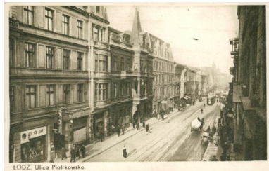
Łódź, ul. Piotrkowska. Przed 1939.

miejskiej na prowincję, gdzie łatwiej było przeżyć wojenną zawieruchę. W wyniku tej migracji populacja Łodzi skurczyła się w okresie wojny niemal o połowę i w 1918 r. liczyła tylko nieco ponad 300 tys. mieszkańców.