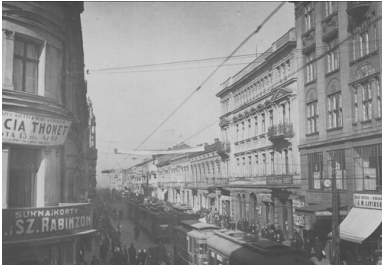
Ulica Piotrkowska w Łodzi. Lata 20. XX w. Druga Rzeczpospolita.