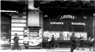
Kawiarnia-restauracja Louvre w Łodzi. 1932. Druga Rzeczpospolita.

Po zakończeniu wojny lukę po Żydach, Niemcach oraz wywiezionych w latach wojny i zamordowanych Polakach wypełniły fale migrującej z prowincji ludności wiejskiej oraz łódzian powracających do rodzinnego miasta z robót przymusowych w Rzeszy i z deportacji do Generalnego Gubernatorstwa. W drugiej połowie 1945 r. zaczęła się też odbudowywać społeczność żydowska w Łodzi. Do miasta napływali Żydzi, którzy ocalili z zagłady na ziemiach polskich, a także ich rodacy repatriowani ze Związku Sowieckiego. 2 Na początku 1946 r. w Łodzi mieszkało już prawie 30 tys. Żydów. Miasto okazało się jednak przede wszystkim przystankiem w ich dalszej wędrówce do Izraela, krajów zachodniej Europy i Stanów Zjednoczonych. Po utworzeniu państwa żydowskiego w 1948 r., w drugiej połowie lat pięćdziesiątych i po wydarzeniach marcowych w 1968 r. łódzcy Żydzi w ogromnej większości wyemigrowali z Polski, opuszczając miasto swych przodków. Na skutek zagłady i emigracji społeczności żydowskiej, ucieczki i przesiedlenia Niemców, a także napływu ludności polskiej z prowincji i przesiedlonej ze wschodu powojenna Łódź stała się w zasadzie miastem jednonarodowym i