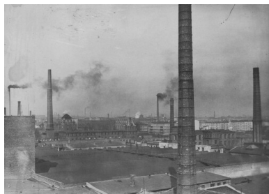
Panorama Łodzi. Druga Rzeczpospolita.