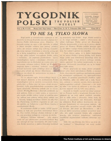
„Tygodnik Polski”