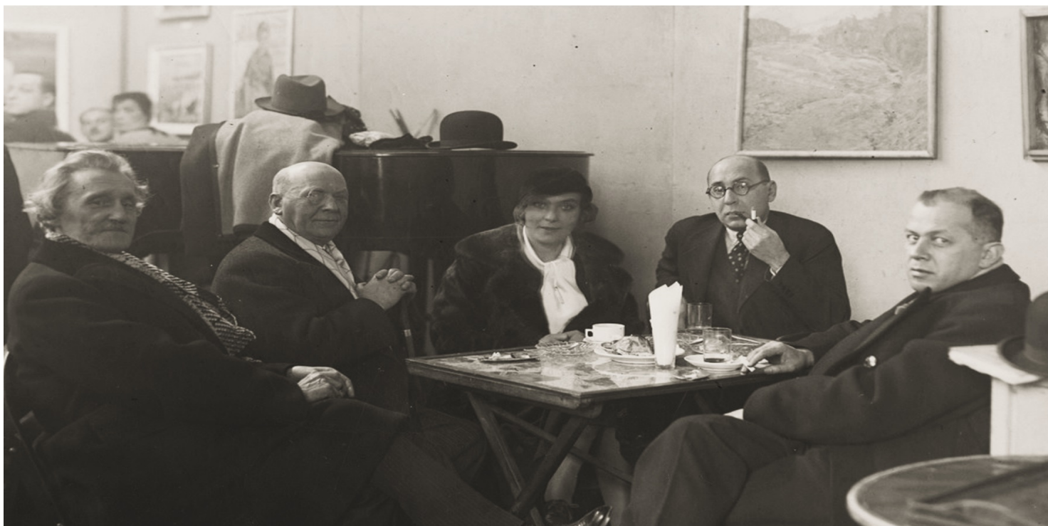
Grupa artystów przy stoliku w kawiarni Instytutu Propagandy Sztuki w Warszawie, 1933 r. Drugi z prawej widoczny Antoni Słonimski

https://przystanekhistoria.pl/pa2/tematy/kultura/125353,Slonimski-w-panstwie-Stalina.html