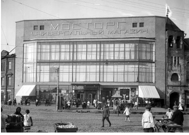
Dom towarowy „Mostorg”, lata 20. XX wieku