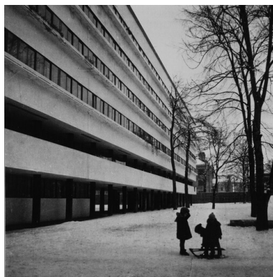
Budynek Narkomfinu, lata 30. XX wieku

Polski literat dość szybko stwierdził, że turystów w ZSRS traktuje się szczególnie – jako źródło dewiz. I tak np. jego hotelowy pokój nie miał łazienki. Mógł oczywiście otrzymać i pokój z łazienką – za 15 dolarów dziennie. Gdyby natomiast chciał zmienić pokój, musiał liczyć się z wydatkiem 2 dolarów. Podobnie w restauracjach dla cudzoziemców za niektóre dania przyjmowano płatności tylko w obcej walucie. Zagranicznych turystów, zwłaszcza jeśli byli pisarzami czy dziennikarzami, poddawano też oddziaływaniu propagandy. Dotyczyło to szczególnie Anglosasów. Ich narodową cechę – ufność – szczególnie upodobali sobie sowieccy agitatorzy.