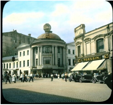
Sklep Torgsinu w Moskwie, 1931 r.