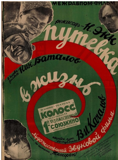
Plakat do filmu Bezdomni , 1931 r.