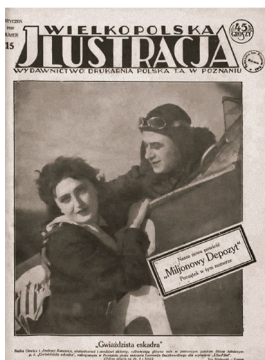
Fotos z filmu Gwiazdzista eskadra na stronie tytułowej tygodnika „Wielkopolska Ilustracja” z 12 stycznia 1930 r.

W tym samym okresie, co Buczkowski (druga połowa lat dwudziestych) rozpoczynali swoje kariery Aleksander Ford, Mieczysław Krawicz, Michał Waszyński 1 i in. Dwa lata po debiucie filmowiec zrealizował najdroższą