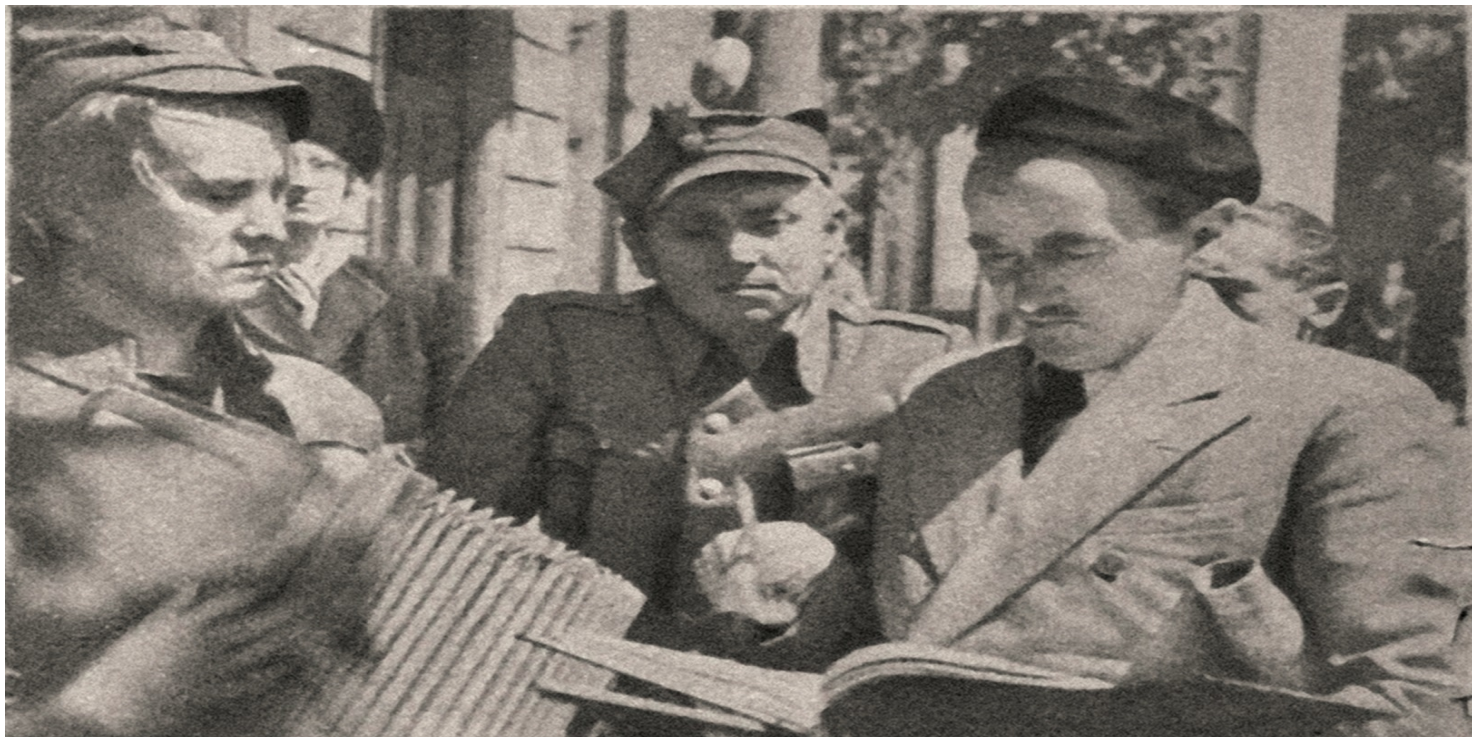
Na planie filmu Zakazane piosenki - od prawej Leonard Buczkowski, Leon Pietraszkiewicz i Czesław Piaskowski.

https://przystanekhistoria.pl/pa2/tematy/kultura/124846,Tworca-dwoch-epok-filmowych-Leonard-Buczowski-19001967.html