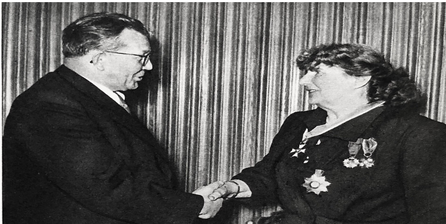
Minister kultury i sztuki Stefan Dybowski wręcza Zofii Nałkowskiej Krzyż Komandorski z Gwiazdą Orderu Odrodzenia Polski z okazji 50-lecia pracy artystycznej, Warszawa 1952 r.

https://przystanekhistoria.pl/pa2/tematy/kultura/104619,Zofia-Nalkowska-Chcemy-calego-zycia.html