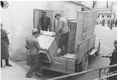
Wyładunek skrzyń z dziełami sztuki na terenie siedziby MBP. Warszawa, październik 1946 r.