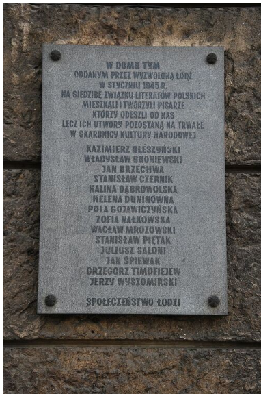
Tablica na Domu Literatów w Łodzi

„Artystom polskim w mieście Łodzi Nie bardzo dobrze się powodzi, (...) Sklepiarz każdy się bogaci, A nędzę cierpią literaci”