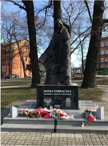
Pomnik Matki Sybiraczki w Zielonej Górze.