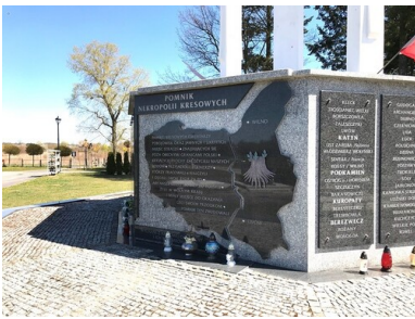
Pomnik Nekropoli Kresowych w Świebodzinie.