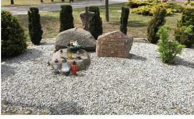
Pomnik ofiar ludobójstwa dokonanego przez nacjonalistów ukraińskich w latach 1939-1947.