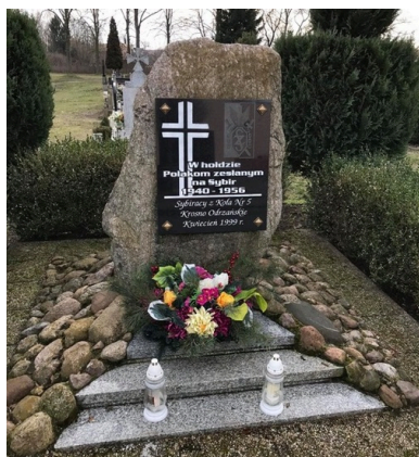
Pomnik upamiętniający polskich obywateli deportowanych z Kresów Wschodnich.

Warto przy tym dodać, że w Krośnie Odrzańskim istnieje również rondo im. Zesłańców Sybiru, które położone jest na skrzyżowaniu drogi krajowej nr 29 i drogi wojewódzkiej nr 276. Oficjalne uroczystości z okazji nadania imienia miały miejsce 17 września 2018 roku, kiedy to na rondzie odsłonięto tablicę z nazwą. W Krośnie Odrzańskim, przy Kole nr 5 Związku Sybiraków, działa również od tego samego roku Klub Wnuków Sybiraków.