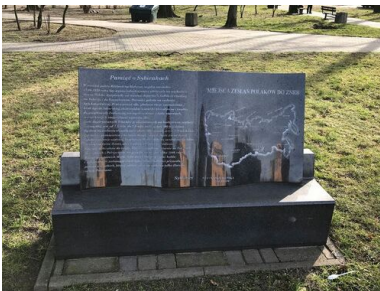
Tablica informacyjna przy pomniku Matki Sybiraczki w Zielonej Górze.