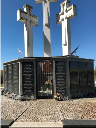
Pomnik Nekropoli Kresowych w Świebodzinie.