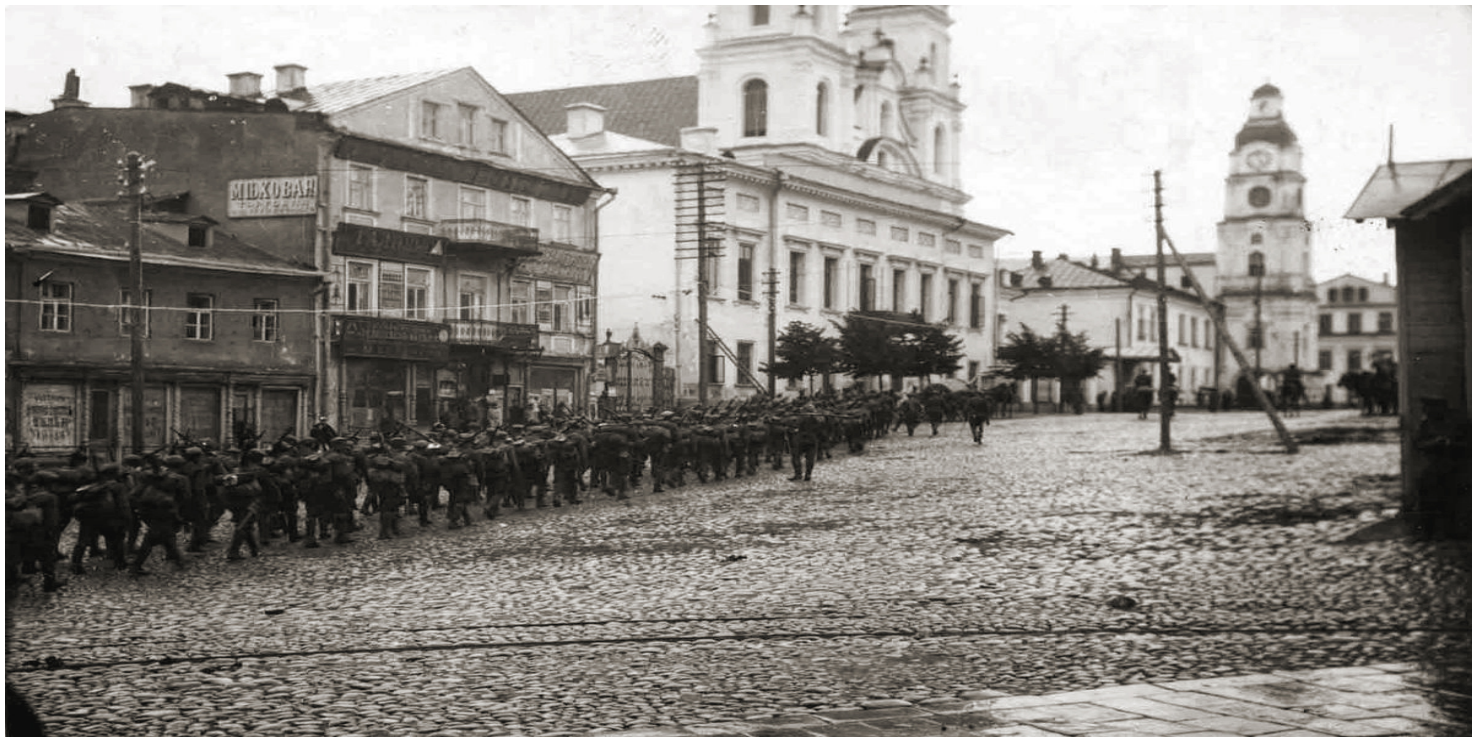
Wojsko Polskie wkracza do Mińska w 1919 r.

https://przystanekhistoria.pl/pa2/tematy/kresy/86062,Traktatem-ryskim-z-swej-ziemi-wygnany-Edward-Woynilowicz-polski-szlachcic-z-Min.html