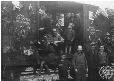
Wagon z ludźmi na jednej ze stacji kolejowych. Fotografia z albumu Państwowego Urzędu Repatriacyjnego, 1945-1946 r.

kamieni czy cegły do budowy domów. Najgorsze są te zupełnie gołe bez żadnego obrzeża. I na tym mają jechać całe rodziny ze swoim dobytkiem, z krowami, końmi, nierogacizną, kurami i wszystkim, co dało się zabrać. Także i z paszą dla bydła. Jak się z tym wszystkim rozmieścić? Miejsca niesłychanie mało. Ale ludzie i tak się cieszą, że wreszcie mają te wagony. Niektórzy czekali na nie całymi tygodniami, koczując w szałasach przy torach. Przy ładowaniu jest niesamowite podniecenie i ogromne ludzkie utrudzenie. [...] Dzisiaj pod wieczór mamy wyjechać. To już ostatni dzień naszego pobytu w tym mieście i na tej ziemi. Ostatnia Msza św. w naszym kościele. I mówią nam, że wyjeżdżamy na zawsze, że Polska już nigdy tutaj nie wróci. Zostawiamy to Bogu i Jego rządzeniom. My tu już teraz nie mamy nic do powiedzenia. Jest jak jest. Wyrzucają nas gwałtem, przemocą i rzeziami.” 2 .