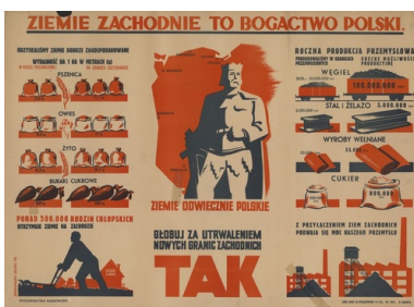
Plakat propagandowy z kampanii referendalnej w 1946 r.

Dynamicznie zmieniająca się sytuacja na terenach powojennej Polski zmusiła władze do reorganizacji zakresu działania PUR i przeniesienia jego zadań na inne podmioty. Już w listopadzie 1945 r. kwestie organizacji akcji repatriacyjnej poza granicami kraju zostały powierzone Generalnemu Pełnomocnikowi Rządu ds. Repatriacji w randze wiceministra, który to urząd podlegał odtąd Ministerstwu Ziemi Odzyskanych. Do tegoż resortu został włączony PUR, który kilka lat później - 22 marca 1951 r. - w ogóle zlikwidowano.