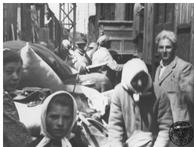
Przesiedleńcy na jednej ze stacji kolejowych. Fotografia z albumu

Przesiedlenia organizowane przez władze komunistyczne miały na celu zaludnienie ziem nowego państwa polskiego Polakami, którzy opuścili kraj w czasie II wojny światowej lub znaleźli się poza nim z powodu przesunięcia granic. W zamyśle więc zjawisko miało dotyczyć zarówno polskich emigrantów, którzy przed 1939 r. lub tuż po nim znaleźli się na terenie państw zachodnioeuropejskich i Ameryki, oraz Polaków, którzy po ustaleniu konferencji teherańskiej i jałtańskiej przebywali się na terenie Związku Sowieckiego. Ziemie polskie, wyludnione wskutek akcji eksterminacyjnej prowadzonej przez okupanta, a także tzw. Ziemie Odzyskane potrzebowały nowych gospodarzy, ludzi do pracy. Z tego też względu sprowadzenie do kraju jak największej liczby Polaków w jak najkrótszym czasie, stało się od samego początku zadaniem priorytetowym dla władz. W działania te zaangażowano wszelkie struktury administracyjne w Polsce oraz placówki dyplomatyczne.