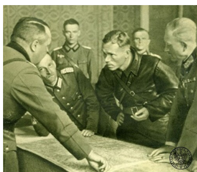
Spotkanie wojsk Niemiec i ZSRS w Brześciu nad Bugiem (woj. poleskie II RP), 22 września 1939. Ustalanie linii demarkacyjnej między oddziałami niemieckimi i sowieckimi. Pierwszy z prawej