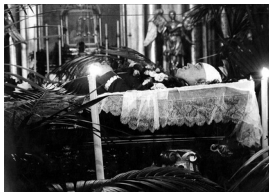
Uroczystości pogrzebowe ministra spraw wewnętrznych Bronisława Pierackiego w Warszawie. Nabożeństwo żałobne w kościele św. Krzyża. 18 czerwca 1934.

Pierwsze podejrzenia w sprawie zamordowania Bronisław Pierackiego padły na Obóz Narodowo-Radykalny. W toku śledztwa pojawiły się niezbite poszlaki świadczące o popełnieniu morderstwa przez ukraińskich nacjonalistów. Dokumenty Ukraińskiej Wojskowej Organizacji i OUN zdobyte wcześniej na terytorium Czechosłowacji posłużyły do wykrycia sprawców mordu na ministrze i rozpracowania kierownictwa OUN w Polsce. W tych warunkach polskie władze podjęły szeroko zakrojone aresztowania, a jesienią 1934 r. OUN przyznała się do przeprowadzenia zamachu na Pierackiego. Pod koniec 1935 r. przed Sądem Okręgowym w Warszawie rozpoczął się proces dwunastu członków organizacji obwinionych o udział w zamachu.