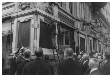
Uroczystość przemianowania ulicy Foksał w Warszawie na ulicę Bronisława Pierackiego. Czerwiec 1934.

W wyniku intensyfikacji działań po zabójstwie ministra Pierackiego wykryto i aresztowano całą Krajową Egzekutywę OUN, ponadto w Berezie Kartuskiej osadzono 176 innych członków organizacji. Działania władz polskich zahamowały częściowo terror ukraińskich nacjonalistów. Jednak OUN jeszcze przed 1939 r. zdołał się odrodzić i dokonać nowych zbrodni.