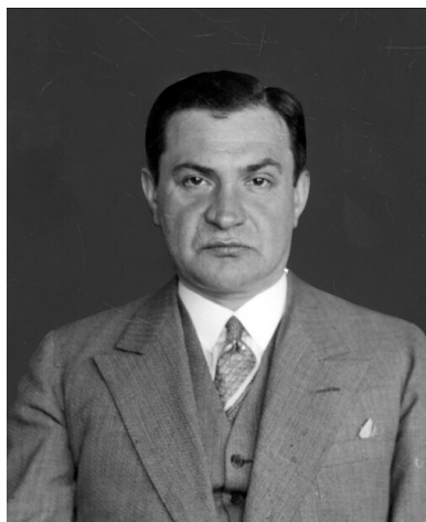
Bronisław Pieracki, minister spraw wewnętrznych.