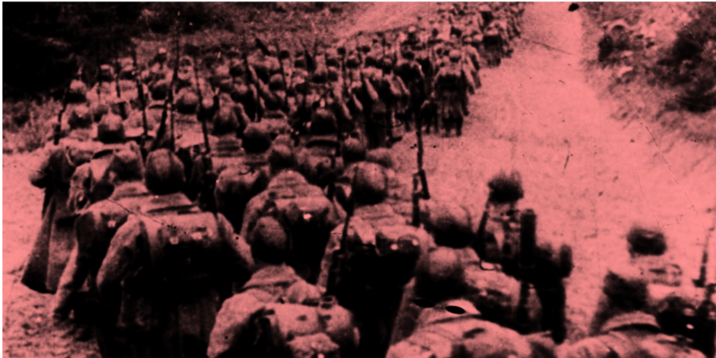
Kolumny piechoty sowieckiej wkraczające do Polski 17 września 1939

https://przystanekhistoria.pl/pa2/tematy/kresy/67158,Kresy-Wschodnie-19401941-Branka-do-Armii-Czerwonej.html