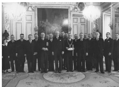
Uroczystość wręczenia Orderu Odrodzenia Polski Politechnice Lwowskiej i profesorowi Kazimierzowi Bartłowi na Zamku Królewskim w Warszawie, 13 lutego 1937 r.