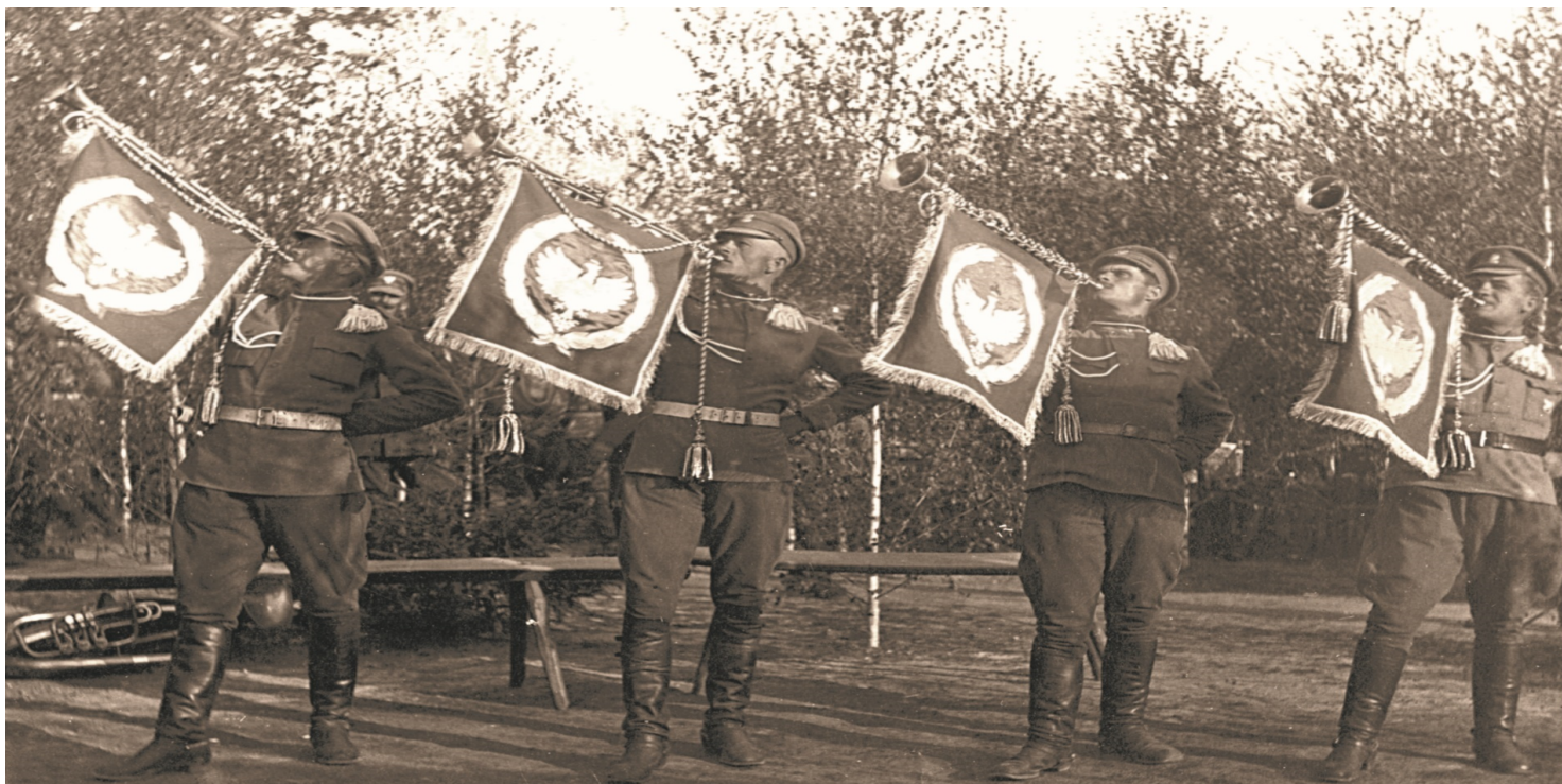
Trębacze i szwadron honorowy 1. Pułku Ułanów na uroczystościach 3 Maja w Bobrujsku, 1918 r. Fot. Wojskowe Biuro Historyczne

https://przystanekhistoria.pl/pa2/tematy/kresy/61743,Rzeczpospolita-Bobrujska-mala-Polska.html