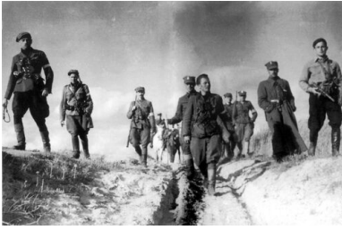
Mjr Zygmunt Szendzielarz Łupaszka (pierwszy z lewej) na czele 5 Brygady Wileńskiej AK