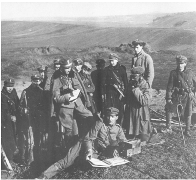
Dowództwo 1 pułku strzelców

W wyniku polskiej ofensywy rozpoczętej 14 maja 1919 r. UHA została zepchnięta na wschód Galicji, do trójkąta pomiędzy Czortkowem i rzekami Dniestr oraz Zbrucz. W walkach wbrew zobowiązaniom władz II RP brały udział oddziały Błękitnej Armii gen. Józefa Hallera sformowanej we Francji. Operacją dowodził gen. Józef Haller. Po dwóch tygodniach, wobec możliwości wybuchu wojny z Niemcami i groźby wstrzymania dostaw uzbrojenia przez Ententę Józef Piłsudski musiał zatrzymać ofensywę.