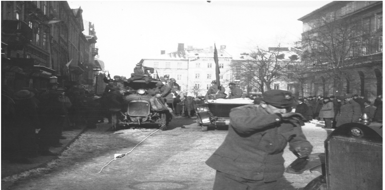
Żołnierze i mieszkańcy Lwowa na rynku w czasie walk listopada 1918 r. (NAC)

https://przystanekhistoria.pl/pa2/tematy/kresy/29389,Wojna-polsko-ukrainska-1918-1919.html