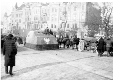
Polski improwizowany samochód pancerny "Józef Piłsudski" na

Władze ZURL przeniosły się do Stanisławowa. 22 stycznia 1919 r. ogłoszono akt formalnego zjednoczenia ZURL i Ukraińskiej Republiki Ludowej, lecz nie przyniósł on poważniejszych konsekwencji. Obydwa państwa miały różne rządy i armie. Na przełomie 1918 r. i 1919 r. w Galicji Wschodniej doszło do wielu napaści zrewoltowanych ukraińskich chłopów na polskie dwory i gospodarstwa.