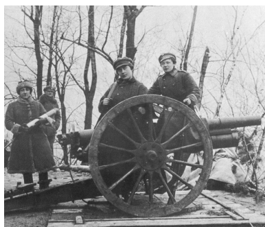
Żołnierze Legi Kobiecej przy armacie na Wysokim Zamku we Lwowie, listopad 1918 r.

W środkowej Galicji społeczeństwo samorzutnie zorganizowało polskie oddziały, zatrzymano posuwanie się Ukraińskiej Halickiej Armii (UHA) na zachód. Lwowa oraz Przemyśla w pierwszym okresie broniła młodzież, a nawet dzieci nazywane Orłętami. W walkach czynny udział brały również kobiety, z których formowano całe oddziały, co stanowiło ewenement na skalę światową. Pod koniec pierwszej dekady listopada w Krakowie z ochotników zorganizowano odsiecz dla Przemyśla i Lwowa. W drodze na front przyłączali się do nich kolejni ochotnicy. 11 listopada 1918 r. odsieczy udało się wyprzeć UHA z Przemyśla.