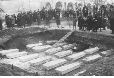
Przeniesienie prochów poległych w obronie Lwowa, 1926 r.