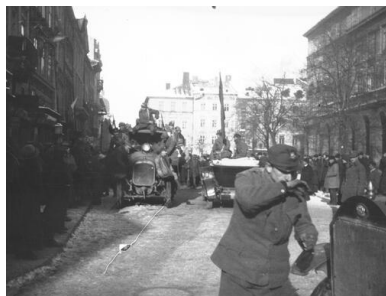
Żołnierze i mieszkańcy Lwowa na rynku w czasie walk listopada 1918 r.

Wobec nadchodzącej militarnej klęski monarchii austro-węgierskiej, 19 października 1918 r. na zjeździe we Lwowie powstała Ukraińska Rada Narodowa. Przyjęła ona rezolucję o utworzeniu państwa ukraińskiego jako części federacyjnej monarchii austriackiej. W jego skład miała wejść wschodnia część Galicji wraz z Łemkowszczyzną. 1 listopada 1918 r. Zachodnioukraińska Republika Ludowa proklamowała swoją niepodległość. Prezydentem i dyktatorem ZURL został polityk Jewhen Petruszewycz. Ukraińcy zajęli Galicję Wschodnią ze Lwowem.