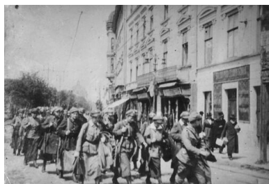
Oddział Ochotniczej Legii Kobiet w marszu przez Lwów, listopad 1918 r.