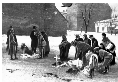
Mogiły poległych na placu Bema we Lwowie, listopad 1918 r.

W okresie międzywojennym pamięć bohaterskich walk o Lwów i Małopolskę Wschodnią z lat 1918-1919 była z namaszczaniem kultywowana. Postawę Orląt stawiano za wzór do naśladowania dla młodzieży. Podkreślano również rolę kobiet-żołnierzy w walkach i ich obywatelską postawę. Miasto Lwów, jako jedyne w Polsce zostało odznaczone Krzyżem Virtuti Militari, który znalazł się w herbie, obok dewizy „Semper Fidelis”.