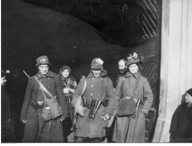
Patrol legionistek w Lwowie, listopad 1918 r.

W tych warunkach płk Hnat Stefanow, dowódca Komendy Głównej UHA wraz ze swoim sztabem w nocy z 12/13 listopada opracował treść ultimatum do dowództwa Wojsko Polskie (WP) w Przemyślu, w którym groził aresztowaniami Polaków, paleniem dworów i zamożnych gospodarstw w przypadku kontynuowania marszu na Lwów. WP kontynuowało szybki marsz na odsiecz Lwowa. Zbrodnie wojenne dokonane przez UHA nie zdołały zatrzymać polskiej strony.