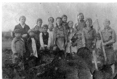
Polscy deportowani z Łomży i ze Lwowa

Latem, w dni wolne od pracy matki zabierały starsze dzieci do lasu zbierać jagody, borówki, żurawinę oraz grzyby. Bardzo popularne były „gruzdzi”, czyli białe grzyby wyglądem przypominające rydze. Zebrane grzyby suszono, bądź też solono i zimą podawano na obiad zamiast mięsa. Uzbierane jagody przesmażano natomiast na powidłą. Pozostałą część zbiorów wymieniano w pobliskim kołchozie na ziemniaki, kaszę, czy też zboże. Dzięki tym „zdobyciom” można było ugotować zupę, która była często jedynym posiłkiem w ciągu całego dnia. Zbierano także, pozostałe po wykopkach w polu, zgniłe ziemniaki – myto je, duszono, dodawano trochę mąki, a następnie pieczono z nich placki.