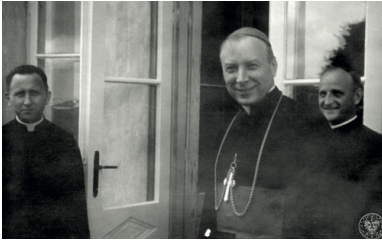
Ksiądz Antoni Baraniak (z lewej) i Prymas Stefan Wyszyński