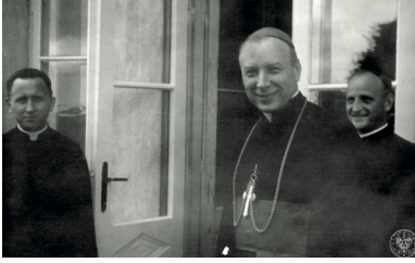
Ksiądz Antoni Baraniak (z lewej) i Prymas Stefan Wyszyński