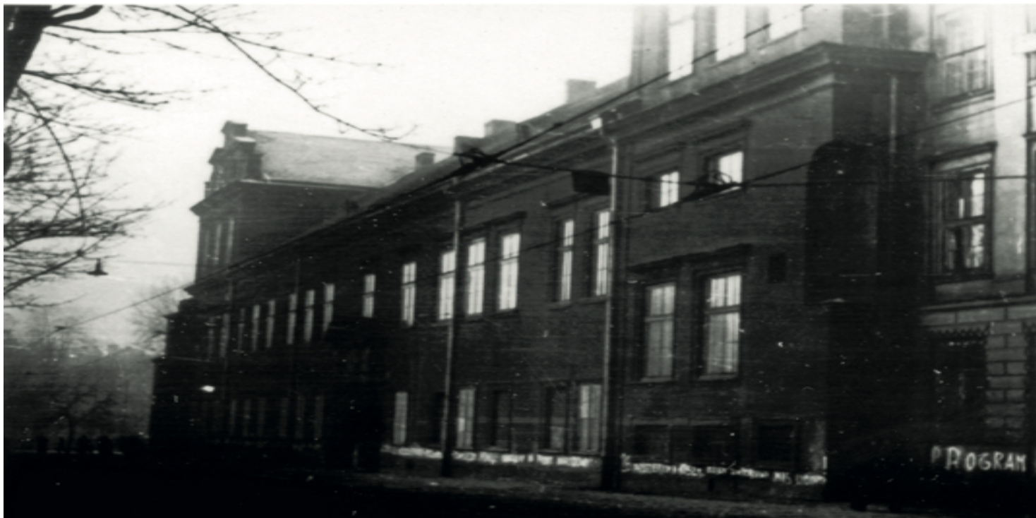
Siedziba kurii krakowskiej; zdjęcie wykonane przez UB (fot. z zasobu IPN)

https://przystanekhistoria.pl/pa2/tematy/kosciol/99150,Proces-kurii-krakowskiej-Komunisci-w-walce-z-Kosciolem.html