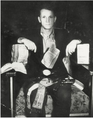
Kapelan Polskiej Podziemnej Armii Niepodległościowej ks. Władysław Gurgacz ps. Ojciec; zdjęcie upozorowane przez bezpiekę, 1949 r.