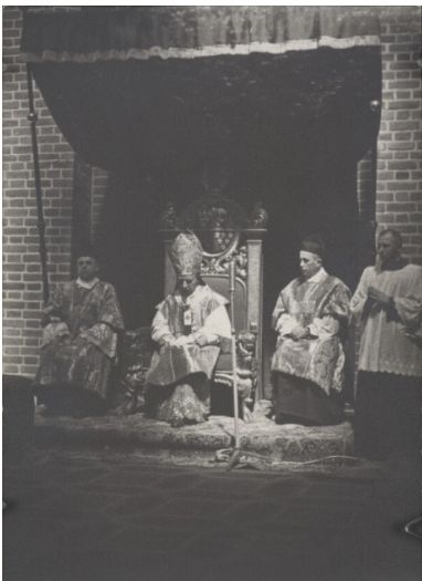
Prymas Stefan Wyszyński podczas uroczystości poświęcenia odbudowanej po II wojnie katedry św. Jana Chrzciciela we Wrocławiu, 29 lipca 1951 r.

Kolejnym etapem represji była likwidacja latem 1952 r. niższych seminariów duchownych. Nadal trwało rugowanie religii ze szkół oraz rozpoczęta w 1949 r. akcja tworzenia szkół ateistycznych.