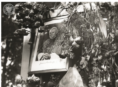
Portret papieża Jana Pawła II na bramie Stoczni Gdańskiej podczas strajku w sierpniu 1980 r.