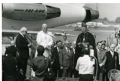
Powitanie Jana Pawła II na lotnisku w Warszawie, 2 czerwca 1979 r. Na lewo od papieża stoi kard. Stefan Wyszyński.

Ksiądz Adam Boniecki, bliski współpracownik Jana Pawła II, redaktor polskiej edycji „L'Osservatore Romano”, wspominał, że papież niezwykle emocjonalnie reagował na strajki na Wybrzeżu. Fascynowało go zwłaszcza to, że robotnicy odrzucili przemoc i masowo brali udział w życiu religijnym na terenie strajkujących zakładów. Nie bez znaczenia było także to, że w tym czasie przebywał w kraju na urlopie wspomniany Stanisław Dziwisz, osobisty sekretarz Jana Pawła II – mógł zatem na miejscu weryfikować wiele informacji i sądów oraz przekazywać swe opinie do Watykanu 4 . Czuwał także Sekretariat Stanu, którym kierował doświadczony i dobrze znający polskie realia kard. Agostino Casaroli. To, co napawało radością i nadzieją serce papieża, z niepokojem było odczytywane przez wytrawnego dyplomata, który oczami wyobraźni widział już być może sowiecką interwencję w Polsce oraz klęskę dialogu między Wschodem a Zachodem, na którym budował założenia watykańskiej polityki wschodniej.