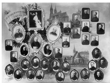
Tableau rocznika kapłańskiego 1924 Wyższego Seminarium Duchownego we Wrocławku