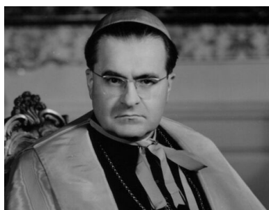
Kardynał Julius Döpfner

List podpisało 41 hierarchów z Niemiec Zachodnich i Wschodnich. Przed wysłaniem odpowiedzi treść prawdopodobnie była konsultowana z zachodnioniemieckim historykiem Kościoła Hubertem Jedinem, który zalecał niepodejmowanie tematów kontrowersyjnych i skoncentrowanie się na ogólnikach i aspektach historycznych.