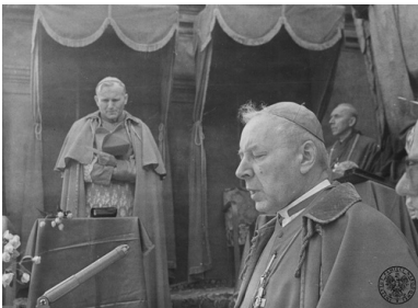
Msza w pierwszą rocznicę uroczystości millenijnych na Jasnej Górze w Częstochowie. Prymas Stefan Wyszyński za ołtarzem, w tle na podwyższeniu Arcybiskup Karol Wojtyła, 3 maja 1973 r.

„mimo różnic między nimi, wyrażają poglądy i wizje katolicyzmu różnego od zachodniego, [...] o wyraźnym ludowym charakterze” 4 .