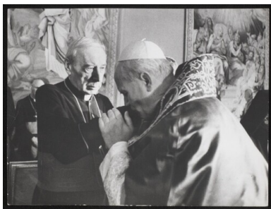
Braterski i ojcowski pocałunek. Kardynał Stefan Wyszyński podczas prywatnej audiencji u Jana Pawła II, 1978.

Zasługuje na szczególne podkreślenie, że z tak wielkim szacunkiem i uwielbieniem Prymas Wyszyński mówił o człowieku od siebie o prawie dwadzieścia lat młodszym, który wcześniej przez kilkanaście lat był jego współpracownikiem w Episkopacie Polski.