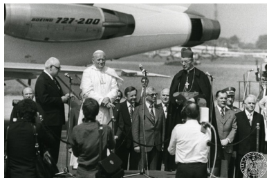
Powitanie Papieża Jana Pawła II na lotnisku w Warszawie, 2 czerwca 1979 r. Po lewej stronie Papieża stoi kard. Stefan Wyszyński.

W Archiwum Sekretariatu Prymasa Polski znajdujemy zarówno komplet protokołów Konferencji Episkopatu Polski, jak i Rady Głównej Episkopatu, a także część zapisów dźwiękowych tych konferencji. Pozwala nam to z całą pewnością powiedzieć, że kard. Wyszyński, choć był uznawany za bezdyskusyjnego lidera polskiego episkopatu, nie narzucał swego zdania pozostałym polskim hierarchom w sposób apodyktyczny, nie wtrącał się też w zasadzie w wewnętrzne sprawy poszczególnych diecezji. W związku z tym szanował opinię i sferę samodzielności poszczególnych członków kierowanego przez siebie episkopatu.