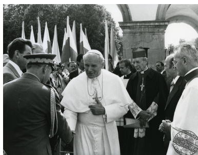
Powitanie Jana Pawła II przy grobie Nieznanego Żołnierza, 2 VI 1979 r.

Wydaje się więc, że podejście do polityki obu hierarchów nie było tak odmienne, jak sugeruje Weigel – łączyło bowiem elementy twardej świadomości realiów politycznych z moralnym obowiązkiem obrony wolności religijnej.