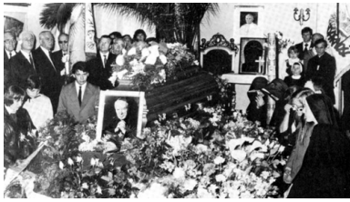
Wystawienie trumny po śmierci prymasa Stefana Wyszyńskiego w Warszawie, 31 maja 1981 r.

znajdował się pod ich wpływem. To raczej on starał się wpływać na redaktorów „Tygodnika Powszechnego”.