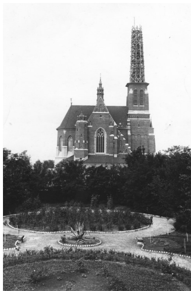
Polska, woj. wołyńskie, Kowel. Kościół Pomnik Krwi i Chwały św. Stanisława Biskupa Męczennika (przełom lat 20. i 30. XX w.; podczas budowy).

Przełożeni skierowali go na probostwo w Grodzisku Mazowieckim, a następnie w Nowym Dworze koło Warszawy. Wreszcie w maju 1930 r. przeniesiono go na Wołyń. Wykładał w Seminarium Duchownym w Łucku, a w 1931 r. został proboszczem w Kowlu. Wówczas właśnie powstała praca Przyczynek do historii męczeństwa Kościoła rzymsko-katolickiego w diecezjach kamienieckiej i łucko-żytomirskiej (1863-1930) . Dzięki jego staraniom dokończono w Kowlu budowę świątyni Pomnik Krwi i Chwały św. Stanisława Biskupa Męczennika. Dziś kościół ten już nie istnieje, bo został rozebrany po II wojnie światowej.