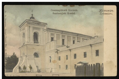
Żytomierz, kościół seminaryjny, przed 1906.

– wspominał 5 . Nie leżało w jego naturze poddawanie się takim nastrojom. Znalazł sobie zajęcie: podczas spędzonych tam łącznie 5 lat uporządkował bibliotekę zasławską – pełną skarbów, takich jak listy Zygmunta Augusta do sułtana tureckiego – i opracowywał książkę Z kronik klasztoru i kościoła oo. bernardynów w Zasławiu 6 . W 1913 r. został wydalony przez władze z diecezji łucko-żytomierskiej.