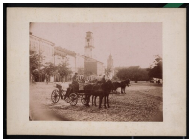
Z albumu fotografii Kamieńca