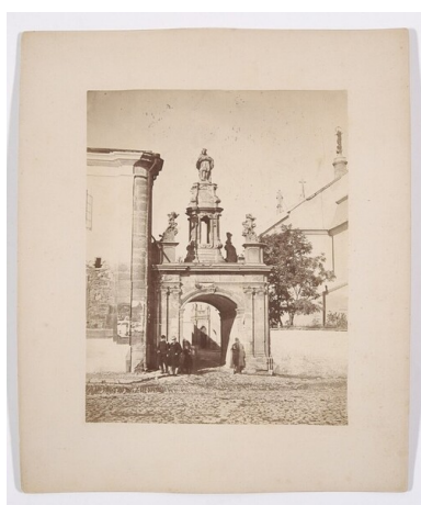
Brama katedralna w Kamieńcu