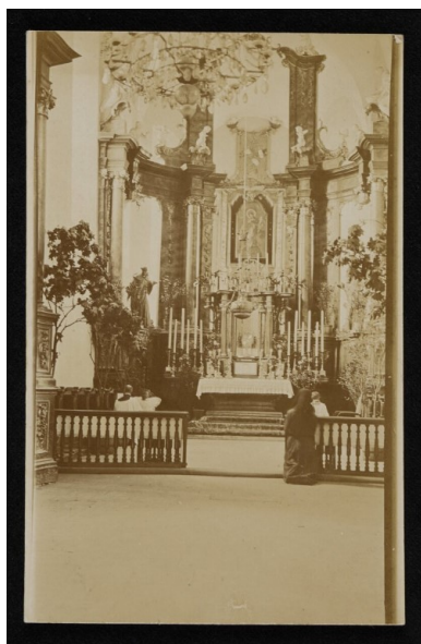
Główny ołtarz w klasztorze oo. Bernardynów w Zaslaviu, 1916. Pocztówka ze zbiorów cyfrowych Biblioteki Narodowej (polona.pl)

„Na wypoczynek jeszcze czas będzie. Zresztą w niebie wypoczywać będziecie po trudach.” 8