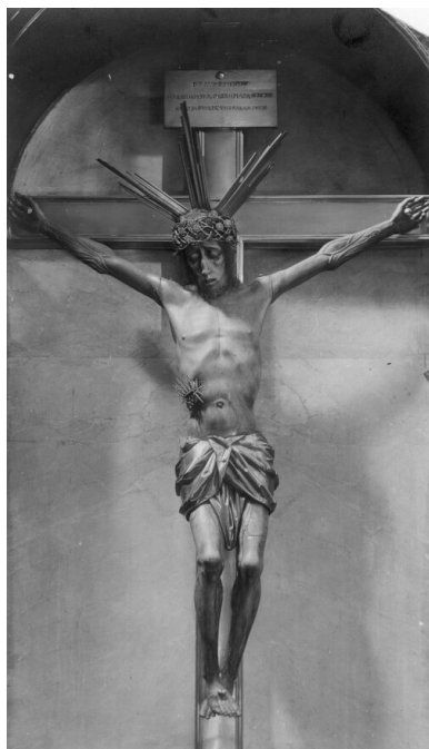
Warszawa, katedra pw. św. Jana Chrzciela. Fragment krucyfiksu

- wspominał ks. Karłowicz. Po zniszczeniu klasztoru słynącą łaskami figurę przeniesiono do Dominikanów, do kościoła św. Jacka. Przykryto ją prześcieradłami i położono na posadzce wśród rannych.