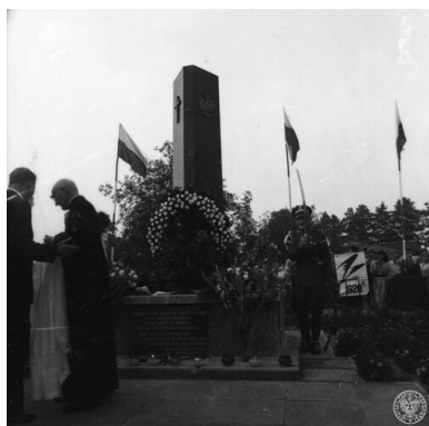
Ossów, 1981, uroczystości patriotyczno-religijne w 61.

Ksiądz Waław – tak jak jego konspiracyjny patron św. Andrzej Bobola – był niestrudzonym duszochwatem. Po wojnie nadal prowadził działalność niepodległościową, a swoją postawą inspirował wielu mieszkańców nie tylko parafii, ale i stolicy do ochrony dziedzictwa narodowego. Parafia św. Waława obejmuje częściowo teren walk z czasów Powstania Listopadowego. Na tym obszarze znajdowały się szczątki prawie siedmiu tysięcy polskich bohaterów poległych w bitwie pod Olszynką Grochowską i niemal dziesięciu tysięcy poległych w niej Rosjan. Jeszcze pod koniec lat 60. XX w. był to teren nieuporządkowany, Powstańcy nie mieli swojej mogiły. Komuniści planowali urządzić tam koszary ZOMO. Właśnie na tym terenie od 1974 roku, z inicjatywy ks. Karłowicza, były celebrowane Msze św. z Apelem Poległych. Każde takie nabożeństwo było zarazem manifestacją patriotyzmu i polskości w zniewolonym przez komunistów narodzie. W 1974 roku powstał też – z inicjatywy ks. Karłowicza i braci Melaków – Krąg Pamięci Narodowej, broniący dziedzictwa i tożsamości narodowej.