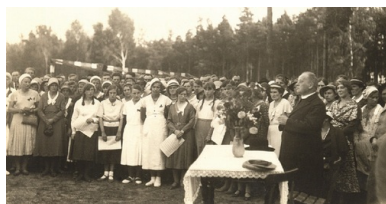
Dzień Pieśni Polskiej w Zakrzewie, 1935 r.

Dla terenów archidiecezji gnieźnieńskiej i poznańskiej oraz diecezji chełmińskiej, które po zakończeniu I wojny światowej znalazły się poza granicami Polski, w dwudziestoleciu międzywojennym utworzono odrębną strukturę kościelną. Kiedy bowiem część dekanatów z obu archidiecezji znalazła się poza granicami Polski, kard. Edmund Dalbor 22 listopada 1920 r. utworzył dla nich delegaturę arcybiskupią z siedzibą w Tucznie, która została rozszerzona 3 sierpnia 1922 r. o trzy dekanaty chełmińskie. Niespełna rok później, 14 maja 1923 r., decyzją Stolicy Apostolskiej delegatura została przemianowana na administraturę apostolską, stając się samodzielnym terytorium administracji kościelnej. W październiku 1926 r. jej siedzibę przeniesiono z Tuczna do Piły. Kolejną ważną datą w dziejach tych dekanatów stał się dzień 13 sierpnia 1930 r., kiedy to Pius XI, w ramach konstytucji apostolskiej Pastoralis officii nostri , utworzył z nich prałaturę „nullius” (terytorialną). Tak powstała Wolna Prałatura Pilska (łac. Territorialis Praelatura Schneidemuhlensis , niem. Freie Prälatur Schneidemühl ).