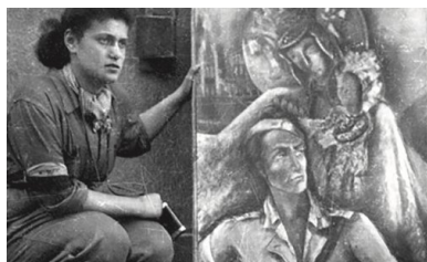
Obraz "Matka Boska Armii Krajowej"