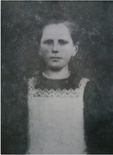
Karolina Kózkówna.