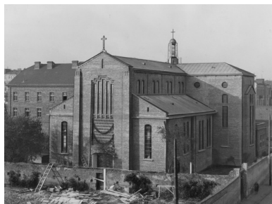
Kościół Redemptorystów pw św. Klemensa Dworzaka przy ulicy Karolkowej, wybudowany w latach 1931-1933.

Taki był początek tego, co dziś nazywamy DLP 'Wola'. Pierwszy okres to działalność przede wszystkim charytatywna, którą już w październiku 1982 r. objęliśmy potrzebujące rodziny pracowników wszystkich zakładów z terenu dekanatu Wola. Dary na te cele otrzymywaliśmy początkowo z Komitetu Prymasowskiego działającego przy kościele św. Marcina na Piwnej. Później transporty darów zagranicznych przychodziły wprost na Karolkową”.