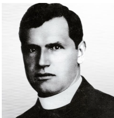
Josef Toufar (1902 - 1950)

Owego grudniowego poranka, w trzecią niedzielę Adwentu, ksiądz Toufar odprawiał codzienną mszę świętą. Wkazaniu mówił o tajemnicy obecności Boga w ludzkim życiu. Gdy wypowiedział słowa: „Tutaj, w tabernakulum, jest nasz Zbawiciel”, część wiernych zgromadzonych w świątyni zauważyła, że półmetrowy krzyż stojący na ołtarzu wyraźnie się przechylił w lewą i prawą stronę pod kątem około 45 stopni. Toufar tego nie zauważył. Po Mszy św. przyszli do niego parafianie, którzy opowiedzieli o tym, co widzieli. Początkowo proboszcz nie przywiązywał do tego większej wagi, lecz kolejne relacje ludzi, którzy widzieli poruszający się krzyż (w sumie około 20 osób) przekonały go, że w istocie to był cud.