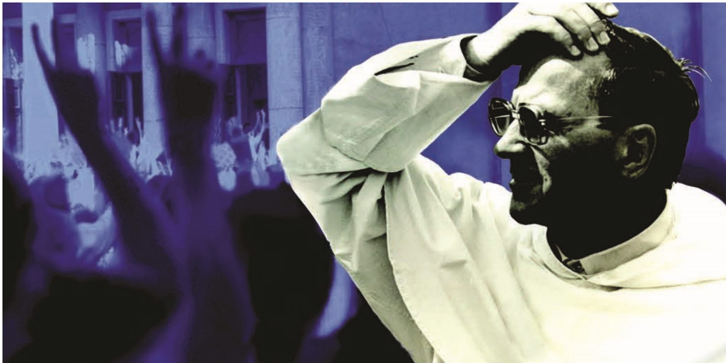
Fot. Okładka katalogu wystawy Wobec opresji. Zmagania o godność, wolność i sprawiedliwość; Pisz życie światłami zawsze.

https://przystanekhistoria.pl/pa2/tematy/kosciol/53815,Bojcie-sie-ludzi-obojetnych-Ojciec-Honoriusz-Kowalczyk-1935-1983.html