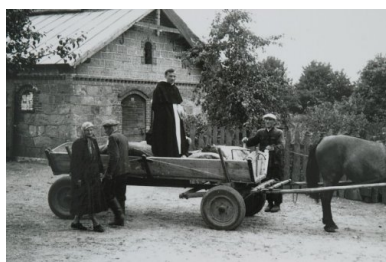
O. Honoriusz Kowalczyk po prymicji, odwożony furmanką na przystanek autobusowy.