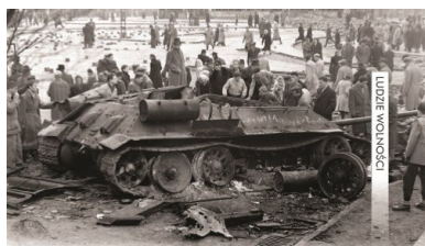
Uszkodzony czołg sowiecki w Budapeszcie, październik 1956 r.