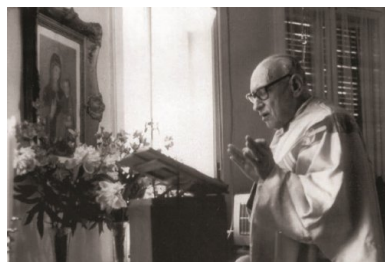
Kard. József Mindszenty po uwolnieniu w 1956 r.