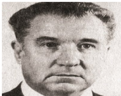
Anatolij Kiriejew.