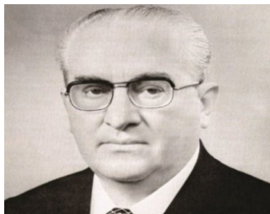
Jurij Andropow, 1983 r.