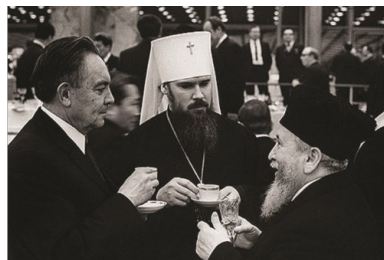
Od lewej: Władimir Kurojedow i metropolita Aleksy II (Ridigier).